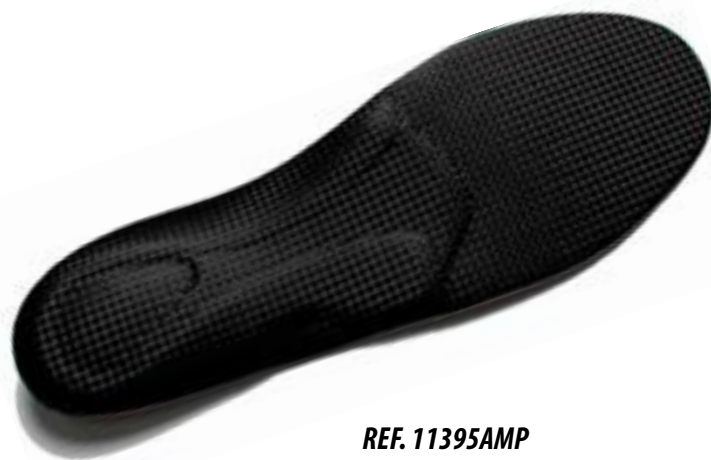
REF. 11395AMP Nº 35/36 al 45/46