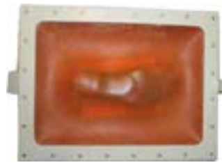
Adaptarla con o sin vacuum