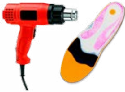
Calentar la plantilla