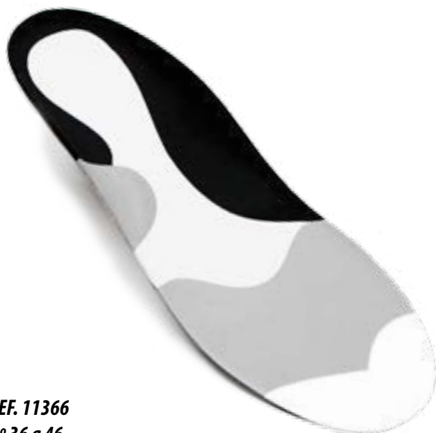
REF. 11366 Nº 36 a 46